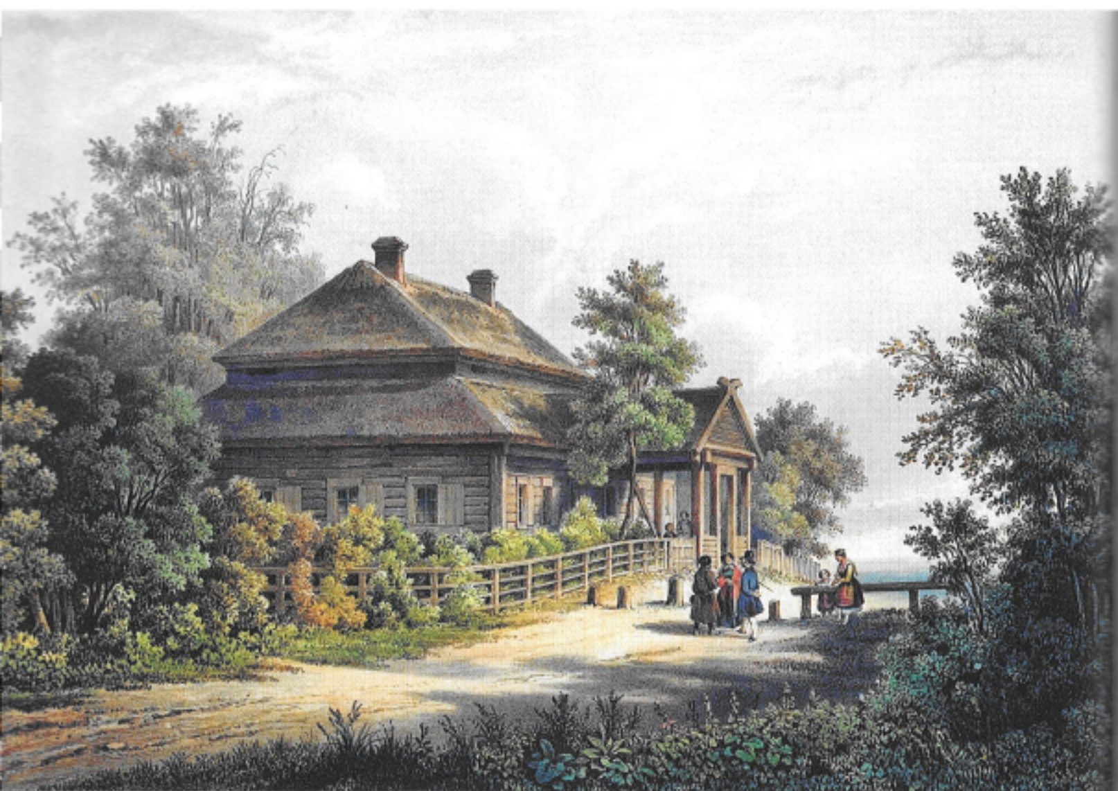
Dworek w Merczowszczyźnie, w którym urodził się Tadeusz Kościuszko, na litografii Victora Adama z 1848 r. Tadeusz spędził w nim pierwsze lata życia, potem rodzina przeniósła się do Siechnowicz.