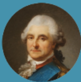
Stanisław August Poniatowski

Wkład Stanisława Augusta Poniatowskiego w Konstytucję wciąż jest przedmiotem sporów. Był królem podporządkowanym Rosji, chętnym do reform w granicach, które tolerowała caryca Katarzyna II. Brał udział w tworzeniu i uchwaleniu Konstytucji, lecz gdy następnie do Polski wkroczyła rosyjska armia, przystąpił do konfederacji targowickiej, a ostatecznie zalegalizował III rozbiór Polski.