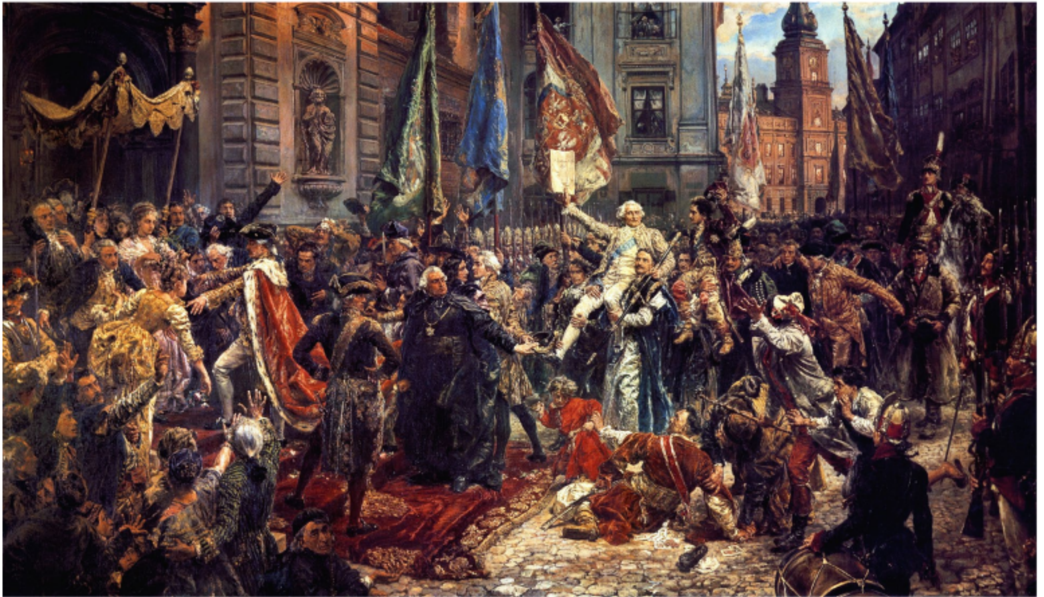
Konstytucja 3 Maja 1791 roku – obraz Jana Matejki wykonany w 1891 r. Jest artystyczną interpretacją momentu po uchwaleniu konstytucji.