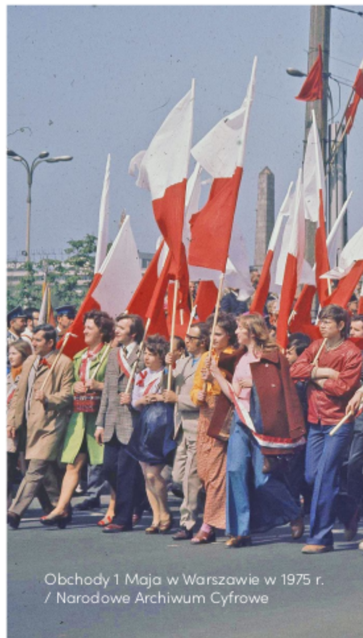
Obchody 1 Maja w Warszawie w 1975 r.

Teraz z okazji Święta Pracy każdy ma prawo się obijać!